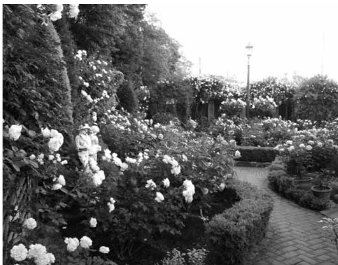
日当たり、風通しのよい場所は一面のローズガーデンに 1日5時間以上日の当たる風通しのよい場所はバラがもっとも好む場所。バラを中心にしたガーデンづくりにも最適。一般的に花弁数が多く繰り返しよく咲く品種ほど日当たりが必要。

設置し、複数の品種の花が次々と咲き乱れるシーンを楽しむのもいいでしょう。門まわりなど人の目がつきやすいコーナーには「繰り返し咲き」、草花と組み合わせて庭の背景としてバラを配置する場合は「一季咲き」など、シーンに合わせて選ぶのがコツです。