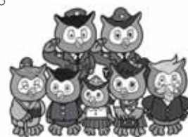
プロフィール画像