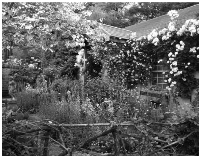
南の花壇は草花との混植で華やかに 長く花を楽しみたい、人目につきやすい場所では、繰り返し咲く「四季咲き」の品種がおすすめ。また草花との混植では、バラの株まわりはコンパクトな草花を選び、バラの成長を妨げないようにしたい。