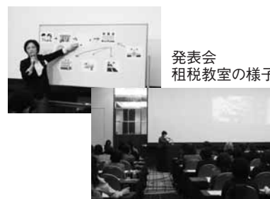
発表会 租税教室の様子