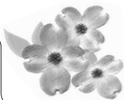
花水木 女性部会の花