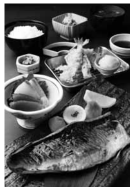
特大とろさば塩焼き定食